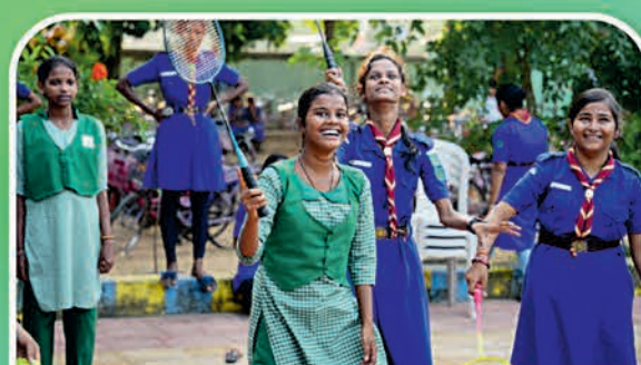
ବରଗଡ଼ ୬୦ ହାଇସ୍କୁଲ