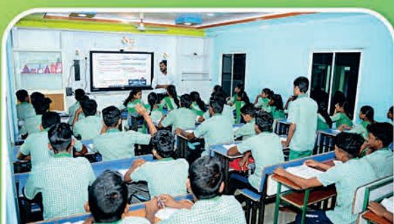
କେନ୍ଦ୍ରାପଡ଼ା ୧୧୨ ହାଇସ୍କୁଲ