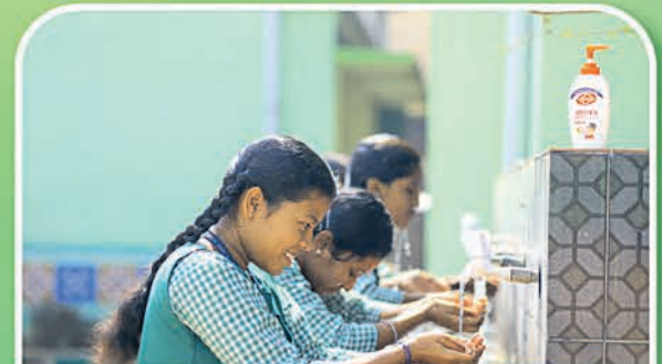
ଜଗତସିଂହପୁର ୫୭ ହାଇସ୍କୁଲ