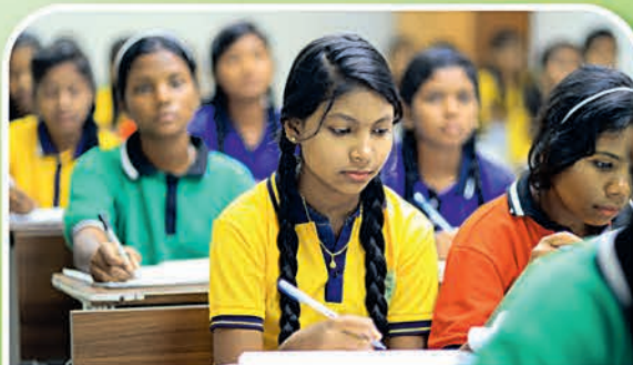
ଝାରସୁଗୁଡ଼ା ୧୧ ହାଇସ୍କୁଲ