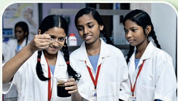
ଗଞ୍ଜାମ ୧୪୯ ହାଇସ୍କୁଲ

ଓଡ଼ିଶାର ମାନ୍ୟବର ମୁଖ୍ୟମନ୍ତ୍ରୀ ଶ୍ରୀଯୁକ୍ତ ନବୀନ ପଟ୍ଟନାୟକଙ୍କ ଦ୍ୱାରା ଲୋକାର୍ପଣ ୧୧ ଜାନୁଆରୀ ୨୦୨୪