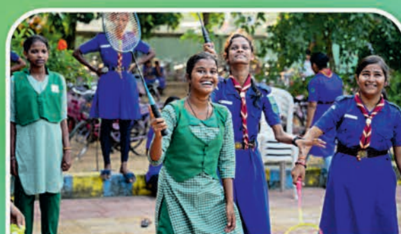
ବରଗଡ଼ ୬୦ ହାଇସ୍କୁଲ