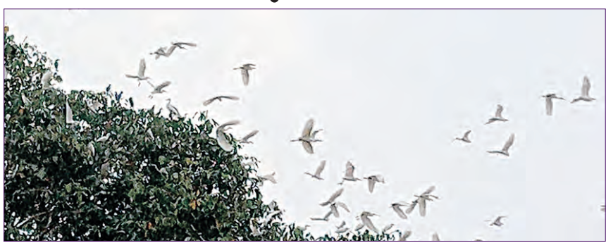
ମାଲକାନଗିରି, ୧୦/୭ (ସମ୍ବିଧ)

ବିଦେଶୀ ପକ୍ଷୀଙ୍କୁ ନୂଆ ଠିକଣା ସାଜିଛି ମାଲକାନଗିରି ଜିଲ୍ଲା। ନୂଆ ଅତିଥିଙ୍କୁ ଦେଖିବାକୁ ବହୁଛି ପର୍ଯ୍ୟଟକଙ୍କ ସଂଖ୍ୟା। ଆଉ ଏଥିପାଇଁ ବନ ବିଭାଗ ପକ୍ଷରୁ ପକ୍ଷୀଗଣନା ଆରମ୍ଭ କରାଯାଇଥିବାବେଳେ ବିଦେଶୀ ପକ୍ଷୀଙ୍କ ସଂଖ୍ୟା ପାଇଁ ବୋଟ୍ ପାଟ୍ରୋଲିଂ ସହ ସତେଜତା ଅଭିଯାନ ଆରମ୍ଭ କରିଛି ବନ ବିଭାଗ।