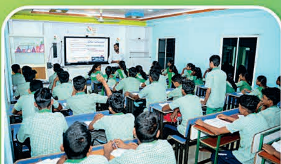
କେନ୍ଦ୍ରାପଡ଼ା ୧୧୨ ହାଇସ୍କୁଲ