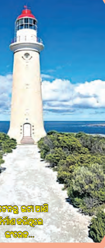
କ୍ରିଟିକରୁ ଲକ୍ଷାଦ୍ୱୀପ ନିର୍ମୂଳ କରିଥିଲେ ଖଟେଲ...