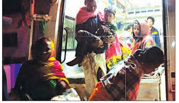
ପାପଡ଼ାହାଣ୍ଡି, ୩୧:୧୨ (ସମ୍ପାଦନା): ଆହତ ହୋଇଛନ୍ତି। ଏହାଦେଖି ଆଜି ରାତି ଧରି ସମୟରେ ଆହତକୁ ଉଦ୍ଧାର କରି ପାପଡ଼ାହାଣ୍ଡି ସ୍ୱତନ୍ତ୍ର ଅନୁସାରେ ପାପଡ଼ାହାଣ୍ଡି ଥାନା ଅନ୍ତର୍ଗତ ଉଦି ଗ୍ରାମର କିଛି ଲୋକ ସାଧୁରୀ ଗ୍ରାମକୁ ଦଶାହ ମାଝିଆଳରେ ଯୋଗ ଦେବାକୁ ଯାଇଥିଲେ। ରାତି ଧରି ସମୟରେ ଘରକୁ ଫେରୁଥିବା ସମୟରେ ପାପଡ଼ାହାଣ୍ଡି ଦୁଇ ବିରିଣି ପଞ୍ଚାୟତ ସଦର ଗ୍ରାମ ପାଖରେ ଭରସାମୟ ହେବା ଅଟେ। ଓଲଟି ପଡିଥିଲା। ଫଳରେ ଅଟୋରେ ଥିବା ା ଜଣ ଆହତ ହୋଇଛନ୍ତି। ଏହାଦେଖି ଗ୍ରାମବାସୀ ୧୦୮କୁ ଫୋନ କରି ଆହତକୁ ଉଦ୍ଧାର କରି ପାପଡ଼ାହାଣ୍ଡି ଗୋଷ୍ଠୀ ସ୍ୱାସ୍ଥ୍ୟକେନ୍ଦ୍ରକୁ ପଠାଇଥିଲେ । ା ଜଣଙ୍କ ମଧ୍ୟରେ ଜଣେ ମହିଳାଙ୍କ ହାତ ଭାଙ୍ଗି ଥିବା ବେଳେ ଜଣେ ଶିଶୁର ମୁଣ୍ଡରେ ଗଭୀର ଷ୍ଟର ହୋଇଥିବା ଜଣାପଡିଛି । ଗୁରୁତରଙ୍କୁ ନବରଙ୍ଗପୁର ଜିଲ୍ଲା ସ୍ୱାସ୍ଥ୍ୟ କେନ୍ଦ୍ରକୁ ସ୍ଥାନାନ୍ତର କରାଯିବ ବୋଲି ତାଙ୍କୁ ସୂଚନା ଦେଇଛନ୍ତି । ଏବେ ପାପଡ଼ାହାଣ୍ଡି ପୁଲିସ ଘଟଣା ସ୍ଥଳରେ ପହଞ୍ଚି ତଦନ୍ତ କରିଛନ୍ତି ।

କରାଟ କାଟି ତାଳକକୁ ବାହାର କରିଥିଲେ। ଗୁରୁତରମାନଙ୍କୁ ବୋରିଗୁମ୍ଫା ଗୋଷ୍ଠୀ ସ୍ୱାସ୍ଥ୍ୟ କେନ୍ଦ୍ରରେ ପ୍ରାଥମିକ ଚିକିତ୍ସା ପରେ କୋରାପୁଟ ମେଡିକାଲ କଲେଜ ଓ ହସ୍ପିଟାଲକୁ ସ୍ଥାନାନ୍ତର କରାଯାଇଥିଲା। ଅନ୍ୟପକ୍ଷରେ ଜିଲ୍ଲାରେ ରାତି ଓ ସକାଳ ସମୟେ ଦିନ ତମାମ ଶୀତର ପ୍ରକୋପ ଜାରି ରହିଥିବାରୁ ଲୋକେ ଘରୁ ବାହାରିବା କଷ୍ଟ ସାଧ ହୋଇ ପଡିଛି । ଗତ ଦୁଇ-ତାରି ଦିନ ହେଲାଣି ଜିଲ୍ଲାରେ ଶୀତର ପ୍ରକୋପ ଓ ଘନ କୁହୁଡି ଜାରି ରହିଥିବା ବେଳେ ତାପମାତ୍ରା ପ୍ରାୟତଃ ୧୬-୧୮ ଡିଗ୍ରୀ ମଧ୍ୟରେ ରହୁଛି। ସେହିପରି ଜିଲ୍ଲାର ସବୁଠାରୁ ଥଣ୍ଡା ଅଞ୍ଚଳ ଭାବେ ପରିଚିତ ପଟ୍ଟାଜି, ଦାମନଯୋଡି ହିଲଟପ, ଲମତାପୁଟ, ମାଛକୁଣ୍ଡ, ପାହୁଆ, ନନ୍ଦପୁର, ନାରାୟଣପାଟଣାରେ ମଧ୍ୟ ଶୀତର ପ୍ରକୋପ ଜାରି ରହିଛି । ଲୋକେ ଶୀତରେ ଅତିଷ୍ଟ ହୋଇ ପଡିଛନ୍ତି। ଗ୍ରୀମାଞ୍ଚଳ ଲୋକେ ରାତିରେ ବିଛଣା ପାଖେ ନିଆଁ ଜାଳି ଶୋଉଥିବା ବେଳେ ଦିନରେ ମଧ୍ୟ ଶୀତରୁ ରକ୍ଷା ପାଇବାକୁ ନିଆଁ ଲଗାଇ ବସି ରହୁଥିବା ଦେଖିବାକୁ ମିଳୁଛି ।