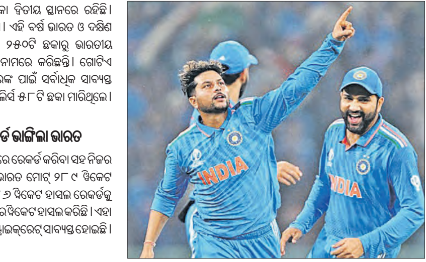
୨୩ ୩୧୨ ହାରରେ ୫ ଶତକ ସହ ୧୫୮୪ ରନ ସଂଗ୍ରହ କରିଛନ୍ତି। ସେହିପରି କୋହଲି ୨୪ଟି ପାକିସ୍ତାନ ୭୨.୪୭ ହାରରେ ୬ ଶତକ ସହ ୧୩୭୭ ରନ ସଂଗ୍ରହ କରି ଦ୍ୱିତୀୟ ସ୍ଥାନରେ ରହିଛନ୍ତି। ଏହା ପଛକୁ ରୋହିତ ୨୨୭୯ ପାକିସ୍ତାନ ୫୨.୨୯ ହାରରେ ୨ ଶତକ ସହ ୧୨୫୫ ରନ ସଂଗ୍ରହ କରିଛନ୍ତି। ଅପରପକ୍ଷରେ ବୋଲିଂରେ ସ୍ଥିର କୁଲଦୀପ ଯାଦବ ୩୦ ମ୍ୟାଚ୍ ଖେଳି ସର୍ବାଧିକ ୪୯୯, ମହମ୍ମଦ ସିରାଜ ୨୫୫ ପାକିସ୍ତାନ ୪୪ ଓ ମହମ୍ମଦ ସାମି ୧୯୯ ପାକିସ୍ତାନ ୪୩ ଓକେଟ୍ ହାସଲ କରି ଯଥାକ୍ରମେ ପ୍ରଥମ, ଦ୍ୱିତୀୟ ଓ ତୃତୀୟ ସ୍ଥାନରେ ରହିଛନ୍ତି।

ଚଳିତ ବର୍ଷ ୨୨୫ଟି ଛକା ମାରି ଦକ୍ଷିଣ ଆଫ୍ରିକା ଦ୍ୱିତୀୟ ସ୍ଥାନରେ ରହିଛି। ୨୦୧୯ରେ ଖେଳିଥିବା ୨୦୯ଟି ଛକା ମାରିଥିଲା। ଏହି ବର୍ଷ ଭାରତ ଓ ଦକ୍ଷିଣ ଆଫ୍ରିକା ଏହି ରେକର୍ଡ୍କୁ ପଛରେ ପକାଇଛନ୍ତି। ୨୫୦ଟି ଛକା ମାରି ଭାରତୀୟ ଅଧିନାୟକ ରୋହିତ ଶର୍ମା ଏକା ୬୭ଟି ନିଜ ନାମରେ କରିଛନ୍ତି। ଗୋଟିଏ କ୍ୟାଲେଣ୍ଡର ବର୍ଷରେ ଏହା ଯେକୌଣସି ବ୍ୟାଟ୍ସମ୍ୟାନ୍ ପାଇଁ ସର୍ବାଧିକ ସାଧ୍ୟତା ହୋଇଛି। ୨୦୧୫ରେ ଦକ୍ଷିଣ ଆଫ୍ରିକାର ଏବି ଡିଭିଲିୟର୍ ୫୮ଟି ଛକା ମାରିଥିଲେ। ରୋହିତ ଏବେ ତାଙ୍କୁ ପଛରେ ପକାଇଛନ୍ତି। ସର୍ବାଧିକ ଓକେଟ୍ ହାସଲରେ ନିଜର ରେକର୍ଡ୍ ଭାଙ୍ଗିଲା ଭାରତ ଏହି ବର୍ଷ ଭାରତୀୟ ଦଳ ସର୍ବାଧିକ ଓକେଟ୍ ହାସଲରେ ରେକର୍ଡ୍ କରିବା ସହ ନିଜର ପୂର୍ବର ରେକର୍ଡ୍କୁ ଅତିକ୍ରମ କରିଛି। ୨୦୨୩ରେ ଭାରତ ମୋଟ ୨୮୯ ଓକେଟ୍ ହାସଲ କରିଛି। ଏଥିପ୍ରତି ଭାରତ ୧୯୯୮ରେ ୨୮୯ ଓକେଟ୍ ହାସଲରେ ରେକର୍ଡ୍କୁ ପଛରେ ପକାଇଛି। ଭାରତ ପ୍ରତ୍ୟେକ ୨୭.୪ ବଲ୍ରେ ଓକେଟ୍ ହାସଲ କରିଛି। ଏହା ଯେକୌଣସି ଦଳ ଓ କ୍ୟାଲେଣ୍ଡର ବର୍ଷ ପାଇଁ ଶ୍ରେଷ୍ଠ ସ୍ୱାଭାବରେ ସାଧ୍ୟତା ହୋଇଛି। ୫ ଓକେଟ୍ ସଫଳତାରେ ରେକର୍ଡ୍ ଭାରତୀୟ ଦଳ ଚଳିତ ବର୍ଷ ୮ ଥର ୫ ଓକେଟ୍ ସଫଳତା ହାସଲ କରିଛି। ପୂର୍ବରୁ ପାକିସ୍ତାନ ୧୯୯୦, ଅଷ୍ଟ୍ରେଲିଆ ୨୦୦୪, ଶ୍ରୀଲଙ୍କା ୨୦୦୮ରେ ୬ଥର ଲେଖାଏ ୫ ଓକେଟ୍ ସଫଳତା ହାସଲ କରିଥିଲେ। ଭାରତ ଚଳିତ ବର୍ଷ ଏହାକୁ ପଛରେ ପକାଇଛି। ଗିଲ୍ ବ୍ୟାଟିଂରେ, କୁଲଦୀପ ପେଲିଂରେ ସଫଳ ଭାରତ ପାଇଁ ବ୍ୟାଟିଂରେ ଚଳିତ ବର୍ଷ ଯୁବ ଓପନର ଶୁଭମାନ ଗିଲ୍ ଓ ବୋଲିଂରେ କୁଲଦୀପ ଯାଦବ ସଫଳତର ବିବେଚିତ ହୋଇଛନ୍ତି। ଗିଲ୍ ୨୯ଟି ପାକିସ୍ତାନ