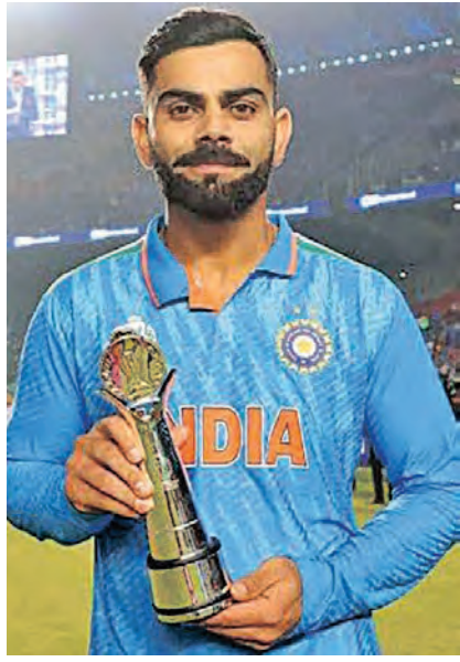
ଦିନିକିଆ ବିଶ୍ୱକପରେ ୫୦ଟି ଶତକ ହାସଲ କରି ବିଶ୍ୱ ରେକର୍ଡ୍ କରିଥିଲେ ଭାରତୀୟ ବ୍ୟାଟ୍ସମ୍ୟାନ୍ ବିରାଟ କୋହଲି।

ନୂଆଦିଲ୍ଲୀ, ୩୧ ୧୨ (ଏକେନି): ବର୍ଷ ୨୦୨୩ ବିଦାୟ ନେଇଛି। ଏହି ବର୍ଷ ଭାରତୀୟ କ୍ରିକେଟ ପାଇଁ ବେଶ୍ ମହତ୍ତ୍ୱ ରଖିଛି। ୨୦୨୩ରେ ଭାରତ ଦିନିକିଆରେ ଜବାବଦତ୍ତ ପ୍ରଦର୍ଶନ କରିଛି। ନିଜର ଦିନିକିଆ ଇତିହାସରେ ଭାରତର ପ୍ରଦର୍ଶନ ସର୍ବଶ୍ରେଷ୍ଠ ରହିଛି। ଏହି ବର୍ଷ ଭାରତ ମୋଟ ୩୫ଟି ଦିନିକିଆ ମ୍ୟାଚ୍ ଖେଳି ୨୭ଟିରେ ବିଜୟ ହୋଇଛି। ଭାରତର ବିଜୟ ପ୍ରତିଶତ ୭୯.୪୦ ରହିଛି। କିନ୍ତୁ ଦିନିକିଆ ଇତିହାସରେ ଏହି ଦୃଷ୍ଟିକୋଣରୁ ଅଷ୍ଟ୍ରେଲିଆ ସବୁଠାରୁ ଆଗରେ ରହିଛି। ୨୦୦୩ରେ ଅଷ୍ଟ୍ରେଲିଆ ୩୫ଟି ଦିନିକିଆ ମ୍ୟାଚ୍ ଖେଳି ୩୦ଟି ବିଜୟ ହାସଲ କରି ସର୍ବଶ୍ରେଷ୍ଠ ପ୍ରଦର୍ଶନ କରିଥିଲା। ଏହି କ୍ରମରେ ଭାରତ ଦ୍ୱିତୀୟ ସ୍ଥାନରେ ରହିଛି। ଏହାପୂର୍ବରୁ ଭାରତ ୧୯୯୮ରେ ଶ୍ରେଷ୍ଠ ପ୍ରଦର୍ଶନ କରିଥିଲା। ଭାରତ ଏହି ବର୍ଷ ୨୪ଟି ଦିନିକିଆ ମ୍ୟାଚ୍ ଜିତିଥିଲା। ୨୦୨୩ରେ ଭାରତ ଗୋଟିଏ କ୍ୟାଲେଣ୍ଡର ବର୍ଷରେ ବିଜୟର ହାରାହାରି ବ୍ୟବଧାନରେ, ସବୁଠାରୁ ଅଧିକଥର ୨୦୦+ ରନରେ ବିଜୟ ହୋଇଥିଲା, ସବୁଠାରୁ ବଡ଼ ସ୍କୋର କରିବାରେ, ସବୁଠାରୁ ଅଧିକ ଶତକ ଅର୍ଜନ କରିବାରେ, ସବୁଠାରୁ ଅଧିକ ଓକେଟ୍ ହାସଲ କରିବାରେ ରେକର୍ଡ୍ ସୃଷ୍ଟି କରିଛି।