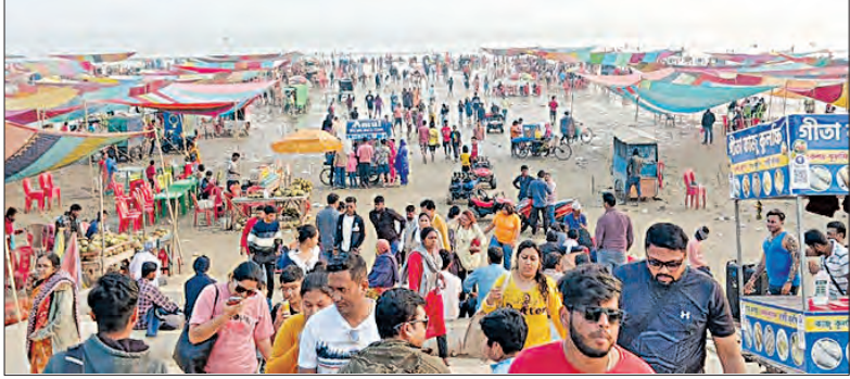
ତନ୍ଦନେଶ୍ୱର, ୩୧ ୧୨ (ସମ୍ପାଦକ):

ଭିଡ଼ ଦେଖିବାକୁ ମିଳିଥିଲା । ରବିବାର ବର୍ଷର ଶେଷ ଦିନରୁ ପ୍ରବଳ ଭିଡ଼ ହୋଇଥିଲା । ତନ୍ଦନେଶ୍ୱର ମନ୍ଦିର, ଭୂଷଣେଶ୍ୱର ଶୈବପୀଠ, କାର୍ତ୍ତିନାଥ ପର୍ଯ୍ୟଟନସ୍ଥଳୀରେ ରବିବାର ପର୍ଯ୍ୟଟକଙ୍କ ପ୍ରବଳ ସମୂହ ଜୁଳୁ, ବିଚିତ୍ରପୁର ପ୍ରକୃତି ନିବାସ,