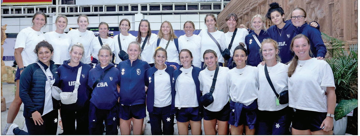
ଓଡିଶାରେ ଫେବୃଆରୀ ୩ରୁ ଖେଳାଯିବାକୁ ଥିବା ଏପିଆଇଏସ୍ ମହିଳା ହକି ପ୍ରୋ ଲିଗ୍ ଲାଗି ସୋମବାର ଆମେରିକା ଦଳ ଭୁବନେଶ୍ୱରରେ ପହଞ୍ଚିଛି।

୫ଟି ମ୍ୟାଚ ଖେଳି ୧୩ଟି ଗୋଲ୍ ଦେଇଛି। ସେହିଭଳି ଉପକେତା ଉଡିଶା ଏପ୍ରିଲ ମାସରେ ୧୦ଟି ଗୋଲ୍ ଲିପ୍ଟାପ୍ ହୋଇଛି। ଇଣ୍ଡିଆର ସିକ୍ୟୁରିଟି ଗାର୍ଡର ମୂଲ୍ୟରେ ଏକ ନିକ୍ଚା ହେବ।