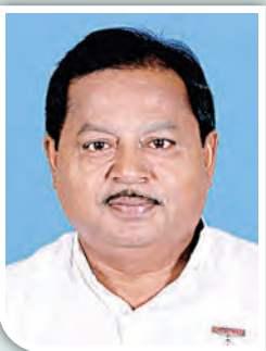
ନିଜ ଭୋଲ ପିଚୁଛନ୍ତି ଭାଲି

ନି ଜ କର୍ମରୁ ଅଧିକ ଲୋଡ଼ିଲେ ହାନିପ୍ରା ହେବା ଥୟ । ତାଙ୍କରି ଭିତରୁ ଜଣେ ହେଲେ ଆମ ସୂର୍ଯ୍ୟନଗର ଜେନାମଣି । ବିକ୍ରମାବୁଙ୍କ ଅବୁଝା ପୁଅ କୁହାଯାଉଥିବା ଜେନାମଣି ବାଲେଶ୍ଵରରୁ ଦିଲ୍ଲୀ ଯାଇଥିଲେ । ବିକ୍ରମଙ୍କ ଅମଳରେ କେନ୍ଦ୍ରରେ କ୍ୟାବିନେଟ ପାହ୍ୟା ମିଳିଥିଲା, ହେଲେ ହାତ ଦଳରେ ଯୋଗ ଦେଇ ରାଷ୍ଟ୍ରମନ୍ତ୍ରୀ ପଦ ପାଇଲେ । ନିଜ ମନ୍ତ୍ରୀ କାର୍ଯ୍ୟକାଳ ସମୟରେ ସିଏ କୁଆଡ଼େ ବାଲେଶ୍ଵରରେ ଢେର କାମଦାମ କରିଥିଲେ ବୋଲି ଶୁଣା ଯାଉଥିଲା, ହେଲେ ଲୋକେ ଆଉ ତାଙ୍କୁ ଚାହିଁଲେ ନାହିଁ । ସେଥିପାଇଁ ୨୦୧୪ରେ ଆସନ ଗଲା, ତା ପରେ ଦଳରୁ ବି ଅଲୋଖ ନିରଞ୍ଜନ ଚଡ଼ିଦେଲେ । ଦଳରୁ ଯିବା ପରେ ବାରୁ ଆରମ୍ଭ କଲେ 'ଧନପଣ୍ଡା' ଅଭିଯାନ । ସେଥିରେ କିଛି ଲାଭ ହେଲା ନାହିଁ । ଆମ ଆତ୍ମା ପାଟିର ମୁଖୁଆ ହେବା ଆଶାରେ ଜେନାମଣି ଭୁବନେଶ୍ଵରରେ ଅରବିନ୍ଦ କେଜରିୱାଲଙ୍କ ସଭା ବି କରାଇଲେ ବୋଲି କେହିକେହି କହିବା ବି ଶୁଣାଯାଇଥିଲା । ସବୁଆଡୁ ନିରାଶ ଜେନାମଣି ଏବେ ଢେର ଦିନ ହେଲା ବସି ଖାଲି ପାନଖୁଆ ଦାନ୍ତ ଖୁଣ୍ଟୁଛନ୍ତି ଆଉ ଚିତ୍ତି ଦେଖୁଛନ୍ତି । ମାତ୍ର ସଦ୍ୟ ମିଳିଥିବା ଖବରଟି ହେଉଛି ପୁଣି ମାଷ୍ଟରକ୍ୟାଣ୍ଡିନ ମଠକୁ ଜେନାମଣି କୁଆଡ଼େ ଫେରିବାକୁ ଆଶା ବାଣିଛନ୍ତି । ହାତ ଦଳର କିଛି ନେତାଙ୍କୁ ଏଥିପାଇଁ କାମରେ ଲଗାଇ ଦେଇଛନ୍ତି । ପଞ୍ଚାନନ ତ ଖୋଲାଖୋଲି ଏ ସଂକ୍ରାନ୍ତରେ ମଠ ମହନ୍ତ ଶରତଙ୍କୁ ପ୍ରସ୍ତାବ ଦେଇ ସାରିଛନ୍ତି । ଖାଲି ଜେନାମଣି କାହିଁକି, ଯେତେସବୁ ପୁରୁଖା କଂଗ୍ରେସିଆ ଅନ୍ୟଦଳର ଦାଣ୍ଡବାରଣ୍ଡାରେ ପଡ଼ିଛନ୍ତି ସମସ୍ତଙ୍କୁ ଦଳକୁ ଫେରାଇ ଆଣିବାକୁ ପରାମର୍ଶ ଦେଇଛନ୍ତି । ମାତ୍ର ଜେନାମଣିଙ୍କ ଲେଉଟାଣିରେ ଏକମାତ୍ର କଣ୍ଟା ହେଉଛନ୍ତି ପୁତୁଲ । ତାଙ୍କୁ ଓ ତାଙ୍କ ପରିବାରକୁ ଜେନାମଣି ଯେଉଁପ୍ରକାର ନିନ୍ଦା ଅପବାଦ ଦେଇଛନ୍ତି ସେ କଥା କୁଆଡ଼େ ପୁତୁଲ ଜୀବଦଶରେ ବି ଭୁଲି ପାରିବେ ନାହିଁ । ଆଉ ପୁତୁଲ ନ ଚାହିଁଲେ, ଜେନାମଣିଙ୍କ ହାତ ପ୍ରବେଶ ଫାଟକ ଖୋଲିବା ପୂରା ଅସମ୍ଭବ । ■