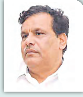
ଜେନାଙ୍କ ଲେଉଟାଣିରେ ପୁତୁଲ କଣ୍ଟା

ଦି ହେଁ କେନ୍ଦ୍ରାପଡ଼ାର ପଦ୍ମ ଦଳିଆ ନେତା; ଜଣେ ଜୟ ଓ ଜଣେ ବିଜୟ । ଦଳ ସେମାନଙ୍କୁ କେତେ ଗୁରୁତ୍ଵ ଦିଏ ସେ କଥା ସେମାନେ ନିଜେ ଜାଣନ୍ତି ଓ ରାଜ୍ୟବାସୀ ବି ଜାଣନ୍ତି । ନିକଟରେ ଦୁଇ ନେତା ଜୟ-ବିଜୟଙ୍କ ଏକ ବୈଠକରେ ଏକାଠି ହୋଇଥିଲେ । ବୈଠକକୁ ଅତ୍ୟନ୍ତ ଗୋପନୀୟ କରିବାକୁ ସବୁ ପ୍ରୟାସ ସତ୍ତ୍ଵେ କେମିତି କେଜାଣି ଖବରଟା ଯାଇ ରାମମନ୍ଦିର ଆଖଡ଼ାରେ ପହଞ୍ଚିଲା । ଦଳର ଏକ ନିର୍ଦ୍ଦିଷ୍ଟ ଗୋଷ୍ଠୀର ସତର୍କ ନିରୀକ୍ଷଣରେ ରହିଥିବା ଦୁଇ ନେତା କେଉଁ ପରିସ୍ଥିତିରେ ଓ କେଉଁ ପ୍ରସଙ୍ଗରେ ଆଲୋଚନା କରିବାକୁ ଏକାନ୍ତରେ ଏକାଠି ହେଲେ ତାହାକୁ ନେଇ ରାମମନ୍ଦିର ଆଖଡ଼ାରେ ଏବେ ଭିନ୍ନଭିନ୍ନ ଚର୍ଚ୍ଚା । ଆଖଡ଼ାରେ ପହଞ୍ଚିଥିବା ଖବର ଅନୁସାରେ ପଦ୍ମ ଦଳରେ ଦୀର୍ଘଦିନ ହେଲା କୋଣଠେସା ହୋଇ ରହିଥିବା ବିଜୟ କୁଆଡ଼େ ନିଜ ପୁଅର ଭବିଷ୍ୟତ ପାଇଁ 'ଆଇ-ଏନଡ଼ିଆଇଏ' (ଇଣ୍ଡିଆ) ମେଣ୍ଟରେ ସାମିଲ ହେବାକୁ ଆଗ୍ରହୀ । ଏ ନେଇ ହାତ ଦଳର କିଛି ନେତାଙ୍କ ସହ ତାଙ୍କର କୁଆଡ଼େ ଅନୌପଚାରିକ ବୈଠକ ମଧ୍ୟ ହୋଇଛି । ଏହି ଖବର ପାଇବା ପରେ ବିଜୟଙ୍କୁ ପଦ୍ମ ଦଳ ନ ଛାଡ଼ିବାକୁ ଜୟ ପରାମର୍ଶ ଦେଇଛନ୍ତି । ଏପରିକି ସେ ଚାହିଁଲେ ତାଙ୍କୁ କେନ୍ଦ୍ରାପଡ଼ା ଲୋକସଭା ଆସନରୁ ଓ ତାଙ୍କ ପୁଅକୁ ପାଟକୁରା ବିଧାନସଭା ଆସନରୁ ଦଳରୁ ପ୍ରାର୍ଥନା କରାଯିବାକୁ ସେ ଉଦ୍ୟମ କରିବେ ବୋଲି ମଧ୍ୟ ଆଶ୍ଵାସନା ଦେଇଛନ୍ତି । ତେବେ ବିଜୟ କୁଆଡ଼େ ଲୋକସଭା ପାଇଁ ଆଗ୍ରହୀ ନ ଥିବା ସତ୍ୟ ମନା କରିଥିଲେ ହେଁ ନିଜର ଆଭିମୁଖ୍ୟ ସ୍ପଷ୍ଟ କରିନାହାନ୍ତି । ମାତ୍ର ନିଜେ ୫ ବର୍ଷ ହେଲା ବାବନାଭୂତ ହୋଇ ବୁଲୁଥିବା ଜୟ ଆଗାମୀ ଦିନରେ ବିଜୟଙ୍କ ପାଇଁ କେତେ ଉପଯୋଗୀ ହେବେ ତାହା ତ ଭିନ୍ନକଥା; କିନ୍ତୁ ବିଜୟଙ୍କୁ ଜୟ ଦେଇଥିବା ଆଶ୍ଵାସନା ତାଙ୍କର ବ୍ୟକ୍ତିଗତ ନା ଦଳୀୟ ତାହାକୁ ନେଇ ସୃଷ୍ଟି ହୋଇଛି ପ୍ରଶ୍ନର ପାହାଡ଼ । ■