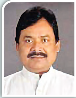
ବୃକ୍ଷରେ ହାତ ମଠ ମହନ୍ତ