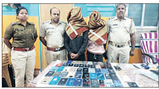
ଗିରଫ ହେଉଥିବା ଗ୍ୟାଙ୍ଗର ଛିନ୍ତା ଗ୍ୟାଙ୍ଗର ଶ ସଦସ୍ୟ ଗିରଫ କରାଯାଇଛି।

ବାରିପଦା, ୨।୧୨ (ସମ୍ପାଦକ): ପ୍ରାୟ ୬୦ ମନେଇ ଗ୍ୟାଙ୍ଗର ଛିନ୍ତା ଗ୍ୟାଙ୍ଗର ଶ ସଦସ୍ୟ ଗିରଫ କରାଯାଇଛି।