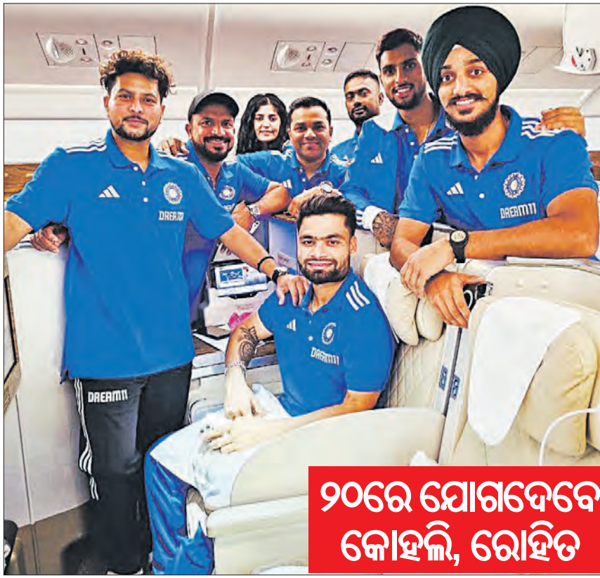
୨୦ରେ ଯୋଗଦେବେ କୋହଲି, ରୋହିତ

ଦକ୍ଷିଣ ଆଫ୍ରିକା ଦଳ (ଏକଦିନ): ଦକ୍ଷିଣ ଆଫ୍ରିକା ଦଳ ଗଠନ କରାଯାଇଛି। ଦଳର ମୁଖ୍ୟ କୋଚ୍ ଏବଂ ଅଧିକାରୀଙ୍କ ସହିତ ଏକ ସମାବେଶ କରାଯାଇଥିଲା। ଦଳର ସମସ୍ତ ଖିଳାଳୀଙ୍କୁ ସମ୍ମାନିତ କରାଯାଇଛି।