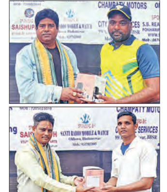
ହାଡ଼ିବନ୍ଧୁ- ସତ୍ୟବାଦୀ ସ୍ମାରକା କ୍ରିକେଟ୍

ଭୁବନେଶ୍ୱର, ୧୩ (ସମ୍ବାଦ): ସ୍ଥାନୀୟ କପିଳପ୍ରସାଦ ସୁନ୍ଦରପଦା ପଢ଼ିଆଠାରେ ଚାଲିଥିବା ପଞ୍ଚଦଶ ହାଡ଼ିବନ୍ଧୁ- ସତ୍ୟବାଦୀ ସ୍ମାରକା କ୍ରିକେଟ୍ ଚୁର୍ଣ୍ଣାମେଣ୍ଟରେ ଗୁରୁବାର ଦୁଇଟି ଅକ୍ତିମ ଲିଗ୍ ମ୍ୟାଚ୍ ଅନୁଷ୍ଠିତ ହୋଇଛି। ଏଥିରେ ଜ୍ୟେମ୍‌ଡି ଲିଜେଣ୍ଟସ୍ ଓ ରେଜିଂ ବ୍ଲାଷ୍ଟର୍ସ ବିଜୟ ହୋଇଛନ୍ତି। ପ୍ରଥମ ମ୍ୟାଚ୍‌ରେ କ୍ୟାପିଟାଲ୍ ଏକାଦଶ ଓ ଜ୍ୟେମ୍‌ଡି ଲିଜେଣ୍ଟସ୍ ପରସ୍ପରକୁ ଭେଟିଥିଲେ। ଲିଜେଣ୍ଟସ୍ ପ୍ରଥମେ ବ୍ୟାଟ୍ କରି ନିର୍ଦ୍ଧାରିତ ୧୬ ଓଭରରେ ୬ ଡିକେଟ୍ ହରାଇ ୧୪୨ ରନ ସଂଗ୍ରହ କରିଥିଲା। ଜବାବରେ କ୍ୟାପିଟାଲ୍ ୧୦୦ ରନକରି ଆଧାରଣ ହୋଇ ପରାସ୍ତ ହୋଇଥିଲା। ଲିଜେଣ୍ଟସ୍ ୬୧ ରନ କରିଥିବା ଚାପ ସ୍ୱାଲି ଶ୍ରେଷ୍ଠ ଖେଳାଳି ବିବେଚିତ ହୋଇଥିଲେ। ସେହିପରି ଦ୍ୱିତୀୟ ମ୍ୟାଚ୍‌ରେ ରେଜିଂ ବ୍ଲାଷ୍ଟର୍ସ ଓ ବଜରଜ ଏକାଦଶ ପରସ୍ପରକୁ ଭେଟିଥିଲେ। ଉଭୟ ଦଳ ସମାନ ୧୨୫ ରନକରିବା ପରେ ସୁପର ଓଭର ଖେଳାଯାଇଥିଲା। ଏଥିରେ ରେଜିଂ ବ୍ଲାଷ୍ଟର୍ସ ବିଜୟ ହୋଇଥିଲା। ରେଜିଂ ବ୍ଲାଷ୍ଟର୍ସ ବିଜୟ ହୋଇଥିଲା। ରେଜିଂ ବ୍ଲାଷ୍ଟର୍ସ ବିଜୟ ହୋଇଥିଲା। ରେଜିଂ ବ୍ଲାଷ୍ଟର୍ସ ବିଜୟ ହୋଇଥିଲା।