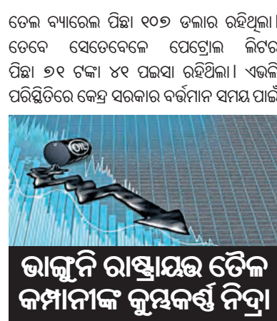
ଭାର୍ତ୍ତୀୟ ରାଷ୍ଟ୍ରୀୟ ତୈଳ କମ୍ପାନୀ କୁମ୍ଭକର୍ଣ୍ଣ ନିଦ୍ରା

ତେଲ ଦର ବଢ଼ିବା ଯୋଗୁଁ ଦେଶରେ ଅତ୍ୟାବଶ୍ୟକ ସାମଗ୍ରୀ ମୂଲ୍ୟ ମହଙ୍ଗା ହେଉଛି । ଏହି ମହଙ୍ଗା ମାତ୍ରରେ ଖାଉଟି ଅଣନିଶ୍ଚିନ୍ତା ହୋଇପଡ଼ିଲେଣି । ଶେଷ ଥର ପାଇଁ ୨୦୦୮ ଜୁଲାଇ ୧୧ରେ ବିଶ୍ଵ ବଜାରରେ ଅଶୋଧିତ ତେଲ ଦର ବ୍ୟାରେଲ ପିଛା ୧୪୭.୦୨ ଡଲାର ରହିଥିଲା । ସେତେବେଳେ ପେଟ୍ରୋଲ ଲିଟର ପିଛା ୪୫ ଟଙ୍କା ୫୬ ପଇସା ଏବଂ ଡିଜେଲ ୩୪ ଟଙ୍କା ୮୬ ପଇସା ରହିଥିଲା । ବର୍ତ୍ତମାନ ଲକ୍ଷ୍ମଣ୍ଡ ଏକ୍ସଚେଞ୍ଜରେ ଦେଶ କ୍ରମେ ଦର ବ୍ୟାରେଲ ପିଛା ୧୦୬.୫୦ ହ୍ରାସ ସହ ୭୬.୫୧ ଡଲାରକୁ ଖସିଆସିଛି । ସେହିପରି ଆମେରିକୀୟ ମର୍ଚାଣ୍ଡାଇଜ ଏକ୍ସଚେଞ୍ଜରେ ଖେଷ୍ଟ ଟେକ୍ସାସ୍ ଇଣ୍ଡି-୧୦୦ (ଡିପ୍ଲୋମାଟିକା) କ୍ରମେ ବ୍ୟାରେଲ ପିଛା ୧୧୫.୫୮ ହ୍ରାସ ଘଟି ୬୯.୩୮ ଡଲାରରେ କାରବାର କରୁଛି । ଏହି ସମୟରେ ଘରୋଇ ବଜାରରେ ପେଟ୍ରୋଲ ଲିଟର ପିଛା ୧୦୩ ଟଙ୍କା ୩୬ ପଇସା ଏବଂ ଡିଜେଲ ୯୪ ଟଙ୍କା ୮୬ ପଇସା ରହିଛି । ୨୦୧୪ରେ ଯେତେବେଳେ ମୋଦୀ ସରକାର କାର୍ଯ୍ୟକାରୀ କରୁଛନ୍ତି ତାହା ଏବେ ଦେଖିବାକୁ ମିଳୁଛି ।