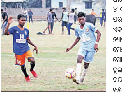
ମ୍ୟାଚ ଅନୁଷ୍ଠିତ ହେଉଛି । ସମସ୍ତ ବୟସ ବର୍ଗରେ ଖେଳାଯାଇଥିଲା ।

କଟକ, ୭ ୧୨ (ସମ୍ବାଦ): ପୁରୀର ଫାଓ ଯୁଦ୍ଧ ଲିଗ ଆରତୋର ଏକାଡେମୀ ବିଜୟୀ ହୋଇଛି । ବିଭିନ୍ନ ବୟସ ବର୍ଗରେ