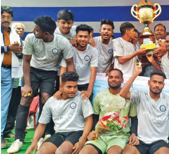
ଭୁବନେଶ୍ଵର, ୩୦ ମାର୍ଚ୍ଚ (ସମ୍ବିଧ)