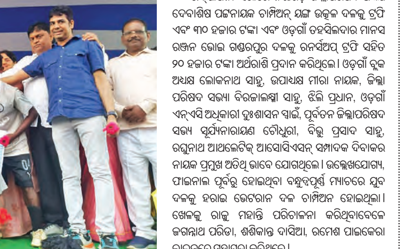
ଭୁବନେଶ୍ଵର, ୩୦ ମାର୍ଚ୍ଚ (ସମ୍ବିଧ)