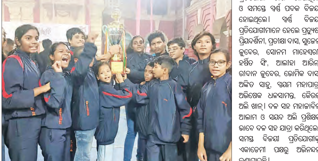
ଭୁବନେଶ୍ଵର, ୩୦ ମାର୍ଚ୍ଚ (ସମ୍ବିଧ)