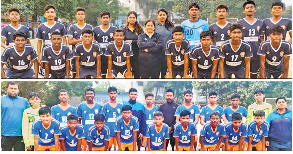
ଭୁବନେଶ୍ଵର, ୩୦ ମାର୍ଚ୍ଚ (ସମ୍ବିଧ)

ପୁରୁଷ ଲିଗ୍ ଆୟୋଜିତ ହେବ । ଏଥିରେ ଭାରତୀୟ ପ୍ରତିଯୋଗିତା ଗ୍ରାଉଣ୍ଡରେ କାନ୍ଦୁଆରୀ ଗାରି ବୋଲି ଓ ଘରୋଇ ଦକ୍ଷିଣ ଆଫ୍ରିକା ମଧ୍ୟରେ ଦ୍ଵିତୀୟ ଥରା ଅଭିମତ ଟେଷ୍ଟ ମ୍ୟାଚ ଖେଳାଯିବ । ସଞ୍ଚରିତରେ ଟେଷ୍ଟ ମ୍ୟାଚ ଖେଳାଯିବ । ପ୍ରଥମ ଟେଷ୍ଟ ମ୍ୟାଚରେ ଭାରତ ଏକ ଇନିଂସ ଓ ୩୨ ରନରେ ଲକ୍ଷ୍ୟାନ୍ତର ଭାବେ ପରାସ୍ତ ହୋଇ ୦-୧ରେ ପଛରେ ପଡ଼ିଛି । ତେଣୁ ସିରିଜ୍‌ରେ ଅଭିମତ ଟେଷ୍ଟ ମ୍ୟାଚରେ ଉପରାଜ୍ୟ ଭାରତକୁ କେପ୍ ଟାଉନ୍‌ରେ ବିଜୟ ହେବାକୁ ପଡିବ । କିନ୍ତୁ କେପ୍‌ଟାଉନ୍‌ରେ ଭାରତର ରେକର୍ଡ ଆସିବେ ଭଲ ନାହିଁ । ଏଠାରେ ଭାରତ ୬ଟି