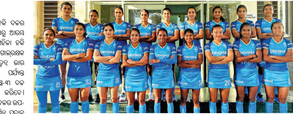
ଭୁବନେଶ୍ଵର, ୩୦ ମାର୍ଚ୍ଚ (ସମ୍ବିଧ)

ଅଗାଧ ପ୍ୟାରିସ ଅଲିମ୍ପିକ୍ ଲାଗି ମହିଳା ହକି ଦଳର ଯୋଗ୍ୟତା ପର୍ଯ୍ୟାୟ ରାଷ୍ଟ୍ରରେ କାନ୍ଦୁଆରୀ ଗାରି ବୋଲି ଓ ଘରୋଇ ଦକ୍ଷିଣ ଆଫ୍ରିକା ମଧ୍ୟରେ ଦ୍ଵିତୀୟ ଥରା ଅଭିମତ ଟେଷ୍ଟ ମ୍ୟାଚ ଖେଳାଯିବ । ସଞ୍ଚରିତରେ ଟେଷ୍ଟ ମ୍ୟାଚ ଖେଳାଯିବ । ପ୍ରଥମ ଟେଷ୍ଟ ମ୍ୟାଚରେ ଭାରତ ଏକ ଇନିଂସ ଓ ୩୨ ରନରେ ଲକ୍ଷ୍ୟାନ୍ତର ଭାବେ ପରାସ୍ତ ହୋଇ ୦-୧ରେ ପଛରେ ପଡ଼ିଛି । ତେଣୁ ସିରିଜ୍‌ରେ ଅଭିମତ ଟେଷ୍ଟ ମ୍ୟାଚରେ ଉପରାଜ୍ୟ ଭାରତକୁ କେପ୍ ଟାଉନ୍‌ରେ ବିଜୟ ହେବାକୁ ପଡିବ । କିନ୍ତୁ କେପ୍‌ଟାଉନ୍‌ରେ ଭାରତର ରେକର୍ଡ ଆସିବେ ଭଲ ନାହିଁ । ଏଠାରେ ଭାରତ ୬ଟି