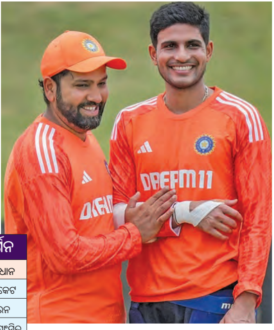
ଟେଷ୍ଟ ଖେଳିଥିଲେ ମଧ୍ୟ ଗୋଟିଏ ହେଲେ ବି ମ୍ୟାଚରେ ବିଜୟ ହୋଇନାହିଁ । ଅନ୍ୟପଟେ ଦକ୍ଷିଣ ଆଫ୍ରିକା ଏଠାରେ ୨୪ଟି ମ୍ୟାଚ ଖେଳି ୧୦ଟି ଟେଷ୍ଟ ଜିତିଛି । ଦକ୍ଷିଣ ଆଫ୍ରିକା ବିଜୟ ପ୍ରତିଶତକ ୪୫.୮ ପ୍ରତିଶତ ରହିଛି ।

ସ୍ଥାନୀୟ ଟ୍ରେନିଂ ଗ୍ରାଉଣ୍ଡରେ କାନ୍ଦୁଆରୀ ଗାରି ବୋଲି ଓ ଘରୋଇ ଦକ୍ଷିଣ ଆଫ୍ରିକା ମଧ୍ୟରେ ଦ୍ଵିତୀୟ ଥରା ଅଭିମତ ଟେଷ୍ଟ ମ୍ୟାଚ ଖେଳାଯିବ । ସଞ୍ଚରିତରେ ଟେଷ୍ଟ ମ୍ୟାଚ ଖେଳାଯିବ । ଯୁଗ୍ମରେ ଟେଷ୍ଟ ମ୍ୟାଚ ଖେଳାଯିବ । ପ୍ରଥମ ଟେଷ୍ଟ ମ୍ୟାଚରେ ଭାରତ ଏକ ଇନିଂସ ଓ ୩୨ ରନରେ ଲକ୍ଷ୍ୟାନ୍ତର ଭାବେ ପରାସ୍ତ ହୋଇ ୦-୧ରେ ପଛରେ ପଡ଼ିଛି । ତେଣୁ ସିରିଜ୍‌ରେ ଅଭିମତ ଟେଷ୍ଟ ମ୍ୟାଚରେ ଉପରାଜ୍ୟ ଭାରତକୁ କେପ୍ ଟାଉନ୍‌ରେ ବିଜୟ ହେବାକୁ ପଡିବ । କିନ୍ତୁ କେପ୍‌ଟାଉନ୍‌ରେ ଭାରତର ରେକର୍ଡ ଆସିବେ ଭଲ ନାହିଁ । ଏଠାରେ ଭାରତ ୬ଟି