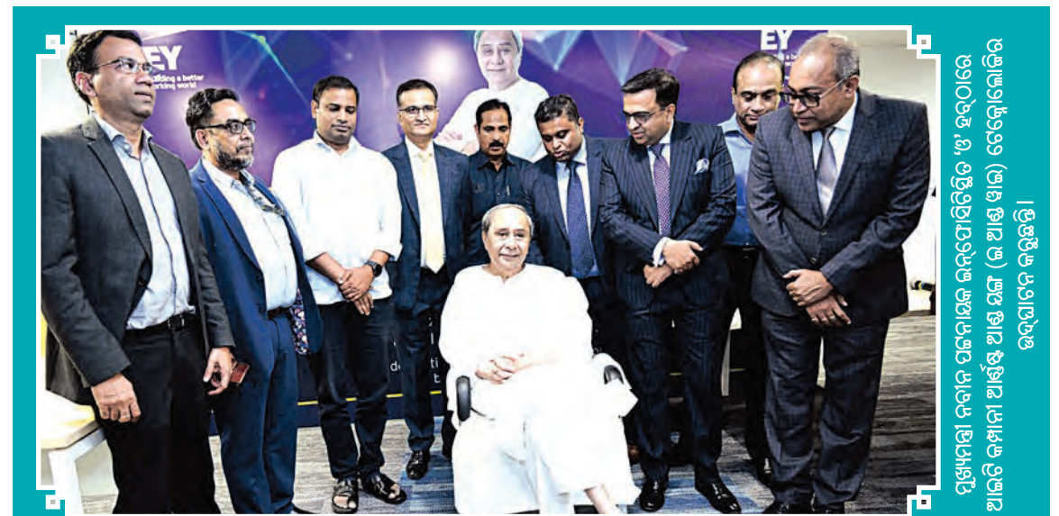
ପୁଖ୍ୟମାନଙ୍କ ସମେତ ପ୍ରତିଷ୍ଠାପତି ଉପସାହାୟକ ରେଭେନ୍ସା ପିଡିଓଏଚ୍ ଆଇଟି କମ୍ପାନୀର ଆଇଟି କମ୍ପାନୀ ଆର୍ଷ୍ଟିଏସ୍ ଆଣ୍ଡ୍ ଅଣ୍ଡ୍ (ଇ ଆଣ୍ଡ୍ ଏଇ) ଟେକ୍ନୋଲୋଜିର ଉଦ୍‌ଯୋଗନ କରୁଛନ୍ତି ।

ଓଡ଼ିଶାରେ ଟୁ-୫ଜି ସେବା ଆରମ୍ଭ ଚଳିତବର୍ଷ ମେ' ମାସରେ ଓଡ଼ିଶାରେ ଟୁ-୫ଜି ସେବାର ଶୁଭାରମ୍ଭ କରାଯାଇଥିଲା । ରିଲାଏନ୍ସ ଜିଓ ପକ୍ଷରୁ ଗାନ୍ଧ୍ୟରେ ଟୁ-୫ଜି ସେବା ଆରମ୍ଭ କରାଯାଇଛି । ମନ୍ଦିରମାଳିନୀ ଭୁବନେଶ୍ୱର ଏବଂ ରୌପ୍ୟ ନଗରୀ କଟକ ଜିଓ ଟୁ-୫ଜି ସେବା ହାସଲ କରିବାରେ ଓଡ଼ିଶାର ପ୍ରଥମ ସହର ହୋଇଛନ୍ତି । ବହୁଫଂଖ୍ୟକ ଛାତ୍ରଛାତ୍ରୀ ରହିଥିବା ତଥା ପୂର୍ବ ଭାରତର ଆଇଟି ଓ ଶିକ୍ଷା ହବ୍ ଭାବେ ପରିଚିତ ଭୁବନେଶ୍ୱରରେ ଜିଓ ଟୁ-୫ଜି ଉଦୟ ନାଗରିକ ଏବଂ ସହର ପରିବର୍ତ୍ତନକାରୀମାନଙ୍କୁ ବ୍ୟାପକ ସୁଯୋଗ ଓ ସମୃଦ୍ଧ ଅନୁଭୂତି ପ୍ରଦାନ କରିବା ଲକ୍ଷ୍ୟ ନେଇ ଆରମ୍ଭ କରାଯାଇଛି । ଏଥିରେ ୬୦୦ ମେଗାହର୍ଜ୍, ୩୫୦୦ ମେଗାହର୍ଜ୍ ଓ ୨୬ ଗିଗାହର୍ଜ୍ ବ୍ୟାଣ୍ଡରେ ୫ଜି ସ୍ପେସ୍ ପାଇବର ସର୍ବବୃହତ୍ ଓ ଶ୍ରେଷ୍ଠ ମିଶ୍ରଣ ରହିଛି । ୫ଜି ପ୍ରକ୍ରିୟାଏତ୍‌ସ୍‌କୁ ଏହା ଏକ ଏକକ ଦୃଢ଼ 'ତାଟା ହାଇଡେ' ରେ ପରିଣତ କରୁଛି ।