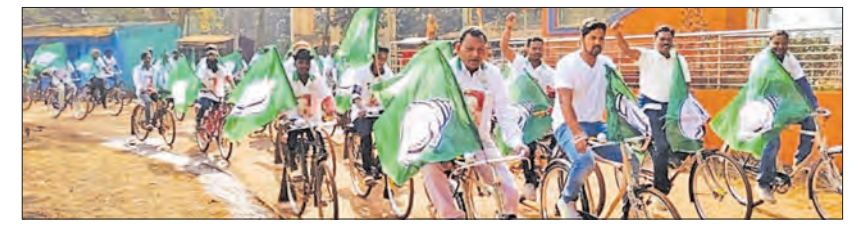
କୋଇଡ଼ା, ୨୭/୧୨ (ସମ୍ପାଦକ):

କୋଇଡ଼ା, ୨୭/୧୨ (ସମ୍ପାଦକ): କୋଇଡ଼ା ବ୍ଲକ୍ ବିଜେଡି କାର୍ଯ୍ୟକ୍ଷେତ୍ରରେ ମଙ୍ଗଳବାର ଦଳର ୨୭ତମ ପ୍ରତିଷ୍ଠା ଦିବସ ପାଳିତ ହୋଇଛି। କୋଇଡ଼ା ବ୍ଲକ୍ ବିଜେଡି କାର୍ଯ୍ୟକ୍ଷେତ୍ରରୁ ଏକ ସାଇକଲ ଶୋଭାଯାତ୍ରା ବାହାରି