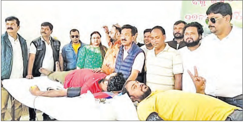
ରାଜରକେଲା, ୨୭/୧୨ (ସମ୍ପାଦକ):

ଜୀବନବିନ୍ଦୁ ରକ୍ତଦାନ ଶିବିରରୁ ୧୦୦ ଯୁନିଟ୍ ରକ୍ତ ସଂଗୃହୀତ