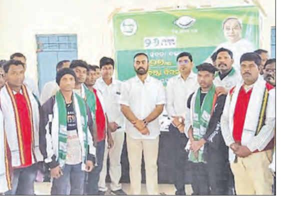
ରାଜରକେଲା, ୨୭/୧୨ (ସମ୍ପାଦକ):