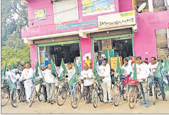
ରାଜରକେଲା, ୨୭/୧୨ (ସମ୍ପାଦକ):