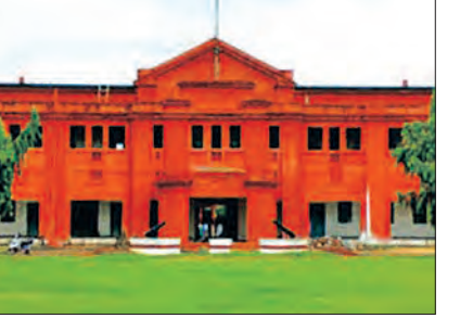
୧୩ ବର୍ଷ ପରେ ବି ଅତିଅଧ୍ୟାପକଙ୍କ ଦ୍ୱାରା ଚାଲିଛି ପାଠପଢ଼ା

କଣ ପ୍ରଫେସରଙ୍କ ଦ୍ୱାରା ଛାତ୍ରଛାତ୍ରୀଙ୍କ ପାଠପଢ଼ା ଚାଲିଛି। ଆହୁରି ୮ଟି ପଦ ଖାଲି ରହିଛି। ସେହିଭଳି କୁଗୋଲ ବିଭାଗରେ ୧୮ଟି ମଞ୍ଜୁରପତ୍ର ପଦକୁ ୬ଟି ଖାଲି ରହିଥିବାବେଳେ ଜିଓଲୋଜିରେ ୧୪ରୁ ୬ଟି ପଦ ଫାଙ୍କା ରହିଛି। ବଙ୍ଗଳାରେ ୨୦ରୁ ୧୨, କେମିଷ୍ଟ୍ରିରେ ୨୪ରୁ ୧୮, ଗଣିତରେ ୧୩ରୁ ୧୧, ଓଡ଼ିଆରେ ୮ରୁ ୩, ଦର୍ଶନଶାସ୍ତ୍ରରେ ୮ରୁ ୨, ବାଣିଜ୍ୟରେ ୧୮ରୁ ୧୨, ଅର୍ଥଶାସ୍ତ୍ରରେ ୧୪ରୁ ୫, ଶିକ୍ଷା ବିଭାଗରେ ୧୪ରୁ ୧୦, ଇଂରାଜୀରେ ୧୨ରୁ ୧୧, ହିନ୍ଦୀରେ ୪ରୁ ୨, ରାଜନୀତି