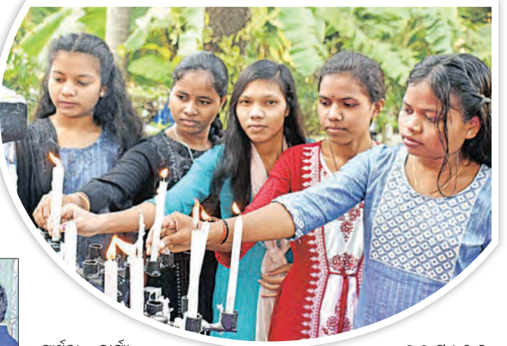
ପ୍ରାର୍ଥନା କାର୍ଯ୍ୟ ହୋଇଥିଲା। ଅନ୍ୟପକ୍ଷରେ ଓଡ଼ିଆ ବାପୁଟିଷ୍ଟ ଚର୍ଚ୍ଚରେ ବଡ଼ଦିନକୁ ମଧ୍ୟ ଧୂମଧାମ୍ରେ ପାଳନ କରାଯାଇଛି। ପ୍ରାୟ ୨୫୦ରୁ ଅଧିକ ଶ୍ରଦ୍ଧାଳୁ ସମୂହ ପ୍ରାର୍ଥନାରେ ସକାଶାଯାଇଛି। ସକାଳ ୯ଟାରେ ଇଂରାଜୀ, ଚେନ୍ନୁ ଏବଂ ଅପରାହ୍ଣ ୨ଟା ୩୦ରେ ଓଡ଼ିଆ ଏବଂ ସନ୍ଧ୍ୟା ୬ଟାରେ ଇଂରାଜୀରେ ପ୍ରାର୍ଥନା କରାଯାଇଛି। ପ୍ରାୟ ୫୫୦ରୁ ଅଧିକ ଶ୍ରଦ୍ଧାଳୁ ସମୂହ ପ୍ରାର୍ଥନାରେ ଯୋଗଦେଇଥିଲେ।

ସଦସ୍ୟମାନଙ୍କୁ ନେଇ ଗପିତ ଏକ ଦଳ କ୍ୟାଥୋଲିକ ଗାଇଛନ୍ତି। ଚର୍ଚ୍ଚର ସଦସ୍ୟମାନେ ପ୍ରତି ଖ୍ରୀଷ୍ଟିୟାନ ଭାଇଭଉଣୀଙ୍କ ଘରକୁ ଘର ଭୁଲି ବଡ଼ଦିନ ପୂର୍ବରୁ ପ୍ରଭୁ ଶିଶୁ ଯାଶୁଙ୍କ ମୂର୍ତ୍ତି ପ୍ରଦାନ କରିବା ସହ ଶାନ୍ତି, ପ୍ରେମର ବାର୍ତ୍ତା ଦେଇଛନ୍ତି। ମଧ୍ୟରାତ୍ରକୁ ମହାଭକ୍ତାଗର ପର୍ବ ଆରମ୍ଭ ହୋଇଥିଲା। ସୋମବାର ଯଜ୍ଞ, କ୍ୟାଥୋଲିକ ଗାନ ଏବଂ