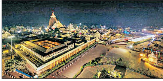
ସେବାୟତଙ୍କ ଉପସ୍ଥିତିରେ ଏ ସଂକ୍ରାନ୍ତରେ ବୃତ୍ତାନ୍ତ ହୋଇଛି। ଆସନ୍ତା ମାର୍ଗଶିର ପୂର୍ଣ୍ଣିମା (୨୬ ତାରିଖ)

■ ଭୁବନେଶ୍ୱର, ୨୪।୧୨ (ସମ୍ପାଦକ): ମାଘମାସ ଶୁକ୍ଳପକ୍ଷ ୬ମୀ ଅର୍ଥାତ୍ ଜାନୁଆରୀ ୧୭ ତାରିଖରେ ଲୋକାର୍ପଣ ହେବ ବହୁ ପ୍ରତୀକ୍ଷିତ ଶ୍ରୀମନ୍ଦିର ପରିକ୍ରମା ପ୍ରକଳ୍ପ। ପ୍ରଭୁ ଶ୍ରୀଜଗନ୍ନାଥଙ୍କ ଏହି ପବିତ୍ର କାର୍ଯ୍ୟକ୍ରମକୁ ଭବ୍ୟ ଭାବରେ ସମ୍ପାଦନ ପାଇଁ ପ୍ରସ୍ତୁତି ଆରମ୍ଭ କରିଛନ୍ତି ଶ୍ରୀମନ୍ଦିର ପ୍ରଶାସନ। ଏହି କାର୍ଯ୍ୟକ୍ରମରେ ଯୋଗଦେବା ନିମନ୍ତେ ଦେଶର ବିଭିନ୍ନ ଦେବପୀଠ ଓ ଧାର୍ମିକ ଗୁରୁମାନଙ୍କୁ ନିମନ୍ତଣ କରାଯିବ। ପୁରୀରେ ରାଜ୍ୟ ପ୍ରଶାସନର ବରିଷ୍ଠ ଅଧିକାରୀ, ଶ୍ରୀମନ୍ଦିର କର୍ତ୍ତୃପକ୍ଷ, ଛତିଶା ନିଯୋଗ ଓ