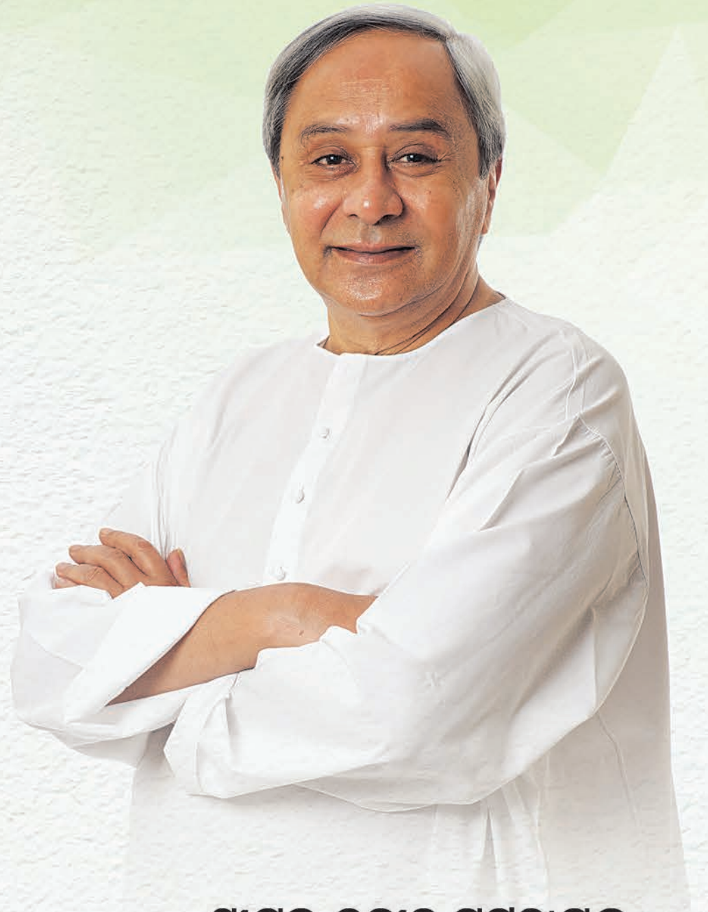
ଶ୍ରୀଯୁକ୍ତ ନବୀନ ପଟ୍ଟନାୟକ ମାନ୍ୟବର ପ୍ରଧାନମନ୍ତ୍ରୀ