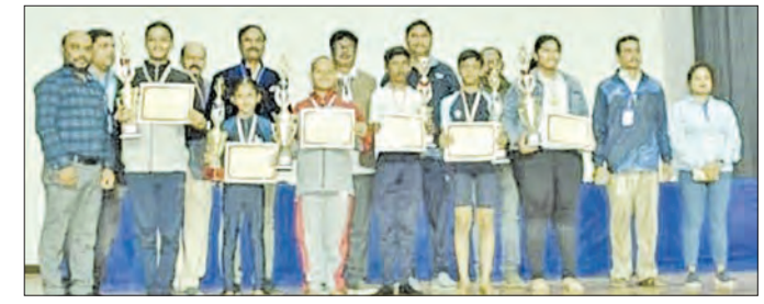
୨୦୦ରୁ ଅଧିକ ବିଭିନ୍ନ ବର୍ଗର ଉତ୍ତରୀୟ ସାଧକ, ବାଳିକା ଏବଂ ପୁରୁଷ ମହିଳା ଏହି ପ୍ରତିଯୋଗିତାରେ ଭାଗ ନେଇଥିଲେ।

ବାରିପଦା, ୧୯ ଡିସେମ୍ବର: ବାରିପଦା ସହର ସ୍ଥିତ ଉତ୍ତରରେ ମହାଶକ୍ତି ଗାର୍ଡସ୍କୁଲ ପାରିଷଦଗୁଡ଼ିକ ଦ୍ୱାରା ପ୍ରତିଯୋଗିତା ପ୍ରତିଷ୍ଠିତ ହୋଇଛି।