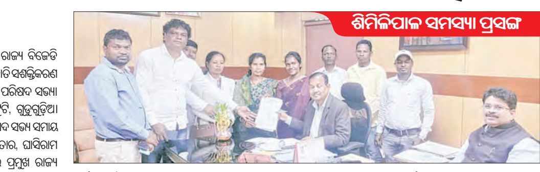
ଶିମିଳିପାଳ ସମାପ୍ତ ହେବା ପରେ ଜଙ୍ଗଲ ମନ୍ତ୍ରୀଙ୍କୁ ଭେଟିଲା ପ୍ରତିନିଧି ଦଳ।

ସନ୍ତକପୁର, ୧୯ ଡିସେମ୍ବର: ଶିମିଳିପାଳ ସମାପ୍ତ ହେବା ପରେ ଜଙ୍ଗଲ ମନ୍ତ୍ରୀଙ୍କୁ ଭେଟିଲା ପ୍ରତିନିଧି ଦଳ।