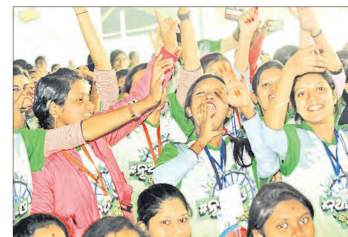
ସମାଧାନ ହେବ। ଏଥିରେ ଜିତିବା ଯେତେକ ଗୁରୁତ୍ୱ ନୁହେଁ, ତାହାକୁ ଅଧିକ ଗୁରୁତ୍ୱ ଦେବା ଯେତେକ ଗୁରୁତ୍ୱ ନୁହେଁ, ଏହା ସହିତ ଆଗ୍ରୀରା ରଖିବାକୁ ପଡ଼ିବ।

ବାରିପଦା, ୧୯ ଡିସେମ୍ବର: ଜୀବନରେ ଆଗକୁ ବଢ଼ିବାକୁ ହେଲେ ଆମ୍ଭେ ଆମ୍ଭେଙ୍କ ଆଗ୍ରୀରା ରଖିବାକୁ ପଡ଼ିବ।