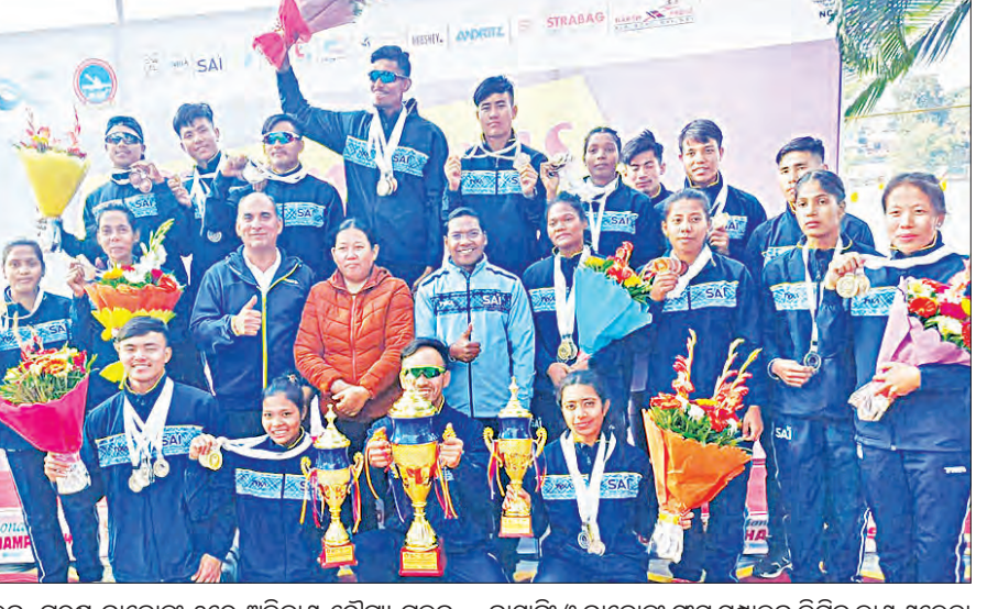
ପଦକ, ପୁରୁଷ କାନୋସ୍ଟିକ୍-୨ରେ ଅବିନାଶ ରୌପ୍ୟ ପଦକ ଜିତିଥିଲେ। ପଦକ ବିଜୟୀ ସମସ୍ତ ଖେଳାଳିଙ୍କୁ ରାଜ୍ୟ ଜଣାଇଛନ୍ତି।

ମଧ୍ୟପ୍ରଦେଶର ଭୋପାଳରେ ଚାଲିଥିବା ଜାତୀୟ କାନୋସ୍ଟିକ୍ ପ୍ରତିଯୋଗିତା ଶେଷ ହୋଇଛି। ଏଥିରେ ଉତ୍ତମ ପୁରୁଷ ଓ ମହିଳା ବର୍ଗରେ ଓଡ଼ିଶା ଦଳଗତ ଭାବେ ରନର୍ସଅପ୍ ହୋଇଛି।