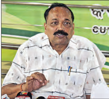
କେନ୍ଦ୍ରକୁ ଦାୟା କଲେ କଟକ ମେୟର

କଟକ, ୨୩।୧୧(ସମ୍ପାଦକ): କଟକ ବାଲିଯାତ୍ରାକୁ ମିଳିଲା ନିଜାତୀୟ ମାନ୍ୟତା। କେନ୍ଦ୍ର ସଂସ୍କୃତି ମନ୍ତ୍ରାଳୟ ପକ୍ଷରୁ ଏହି ଯାତ୍ରାକୁ କଟକ ମେୟର ଉଲ୍ଲେଖ କରାଯାଇଛି ଯେ ବାଲିଯାତ୍ରାକୁ ଜାତୀୟ ମାନ୍ୟତା ଦେବା ପାଇଁ ମନ୍ତ୍ରାଳୟ ଅଧୀନରେ ନାହିଁ। ଏବେ କେନ୍ଦ୍ର ସଂସ୍କୃତି ଶ୍ରୀ ବି ଏକ ସାମ୍ବାଦିକ ସମ୍ମିଳନୀରେ ଉଦ୍ଦେଶ୍ୟ ପ୍ରକାଶ କରିଛନ୍ତି। ସେ କହିଛନ୍ତି, ଓଡ଼ିଆ ଲୋକ ଭାବରେ ଯାତ୍ରା ଲାଗିଛି। ଏହି ଯାତ୍ରାକୁ କଟକ ବାଲିଯାତ୍ରା ଗୌରବପୂର୍ଣ୍ଣ ଭାବେ ପ୍ରତି କୁଠାଯାତ୍ରା ହୋଇଛି। ୨୦୧୯ରେ ମୁଖ୍ୟମନ୍ତ୍ରୀ ନବୀନ