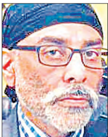
ଭାରତକୁ ଚେତାବନା ଦେଲା ଆମେରିକା

ଦୁଆବିଲ୍ଲା, ୨୨୧୧ (ଏକେନ୍ଦ୍ରି): ଖଲିଷ୍ଟାନୀ ଆତଙ୍କବାଦୀ ତଥା ଶିଖ୍ ଫର ଜଣିଷ୍ ପନ୍ଥୁଙ୍କୁ ଆମେରିକାରେ ହତ୍ୟା ଉଦ୍ୟମକୁ ଆମେରିକୀୟ ସୁରକ୍ଷା ଏଜେନ୍ସି ପକ୍ଷ କରିଦେଇଥିବା ଆମେରିକା କହିଛି। କିନ୍ତୁ ପନ୍ଥୁଙ୍କୁ ହତ୍ୟା କରିବାକୁ ଉଦ୍ୟମ କରାଯାଇଥିବା ସ୍ୱତନ୍ତ୍ର ଭାବରେ ହାତ ରହିଥିବା ବର୍ଗାଲ ଆମେରିକା ଭାରତ ପ୍ରତି ଚେତାବନା ମଧ୍ୟ ଦେଇଛି। ତେବେ କିଏ ପନ୍ଥୁଙ୍କୁ ହତ୍ୟା କରିବାକୁ ଉଦ୍ୟମ କରିଥିଲା ଏବଂ ଏହି ଘଟଣାରେ କିଭଳି ଭାରତର ହାତ ରହିଛି ସେନେଇ ଆମେରିକୀୟ ଆମେରିକୀୟ ଏଜେନ୍ସି ପ୍ରଶ୍ନାସନ କରି କହି ନାହିଁ। ଅନ୍ୟପକ୍ଷରେ ପନ୍ଥୁଙ୍କୁ ହତ୍ୟା ଉଦ୍ୟମ କରିଥିବା ବ୍ୟକ୍ତି ଜଣକ ବର୍ତ୍ତମାନ ଆମେରିକା ଛାଡି ଦେଇଥିବା