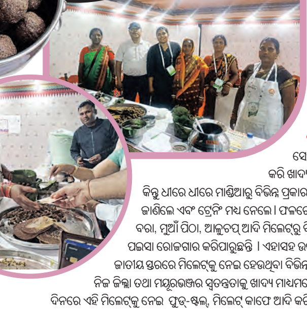
ପ୍ରଥମ କରି ମାଣ୍ଡିଆ ଚାଷ ସେମାନେ ଆରମ୍ଭ କଲେ । ଏହି ଚାଷ ପାଇଁ ସରକାରଙ୍କ ତରଫରୁ ମାଗଣାରେ ବିହନ ଯୋଗାଇ ଦିଆଯାଇଥିଲା । ପରେ ସେମାନଙ୍କର ଚାଷ ମଧ୍ୟ ଜଳ ହୋଇଥିଲା । ପ୍ରଥମେ ଏହାକୁ ସରକାରଙ୍କୁ ବିକ୍ରି କରାଯାଉଥିଲା । ପରେ ସ୍ଥାନୀୟ ଲୋକମାନଙ୍କର ମଧ୍ୟ ଚାହିଦା ବଢ଼ିଲା । ଫଳରେ ସମଗ୍ର ଜିଲ୍ଲାକୁ ଏହା ବିକ୍ରି କରାଗଲା ।

ଦେଶୀ ଖାଇବାକୁ ଲୋକଲୋଚନକୁ ଆଣିବାର ପ୍ରୟାସ: ମାଣ୍ଡିଆ କ'ଣ ସେମାନେ ଜାଣିଥିଲେ । କିନ୍ତୁ ଏହାକୁ ଚାଷ କରି ରୋଜଗାର କରି ହେବ ଏହା କେବେ ସେମାନେ ଭାବି ନ ଥିଲେ । ଓଡ଼ିଶା ମିଲେଟ୍ ମିଶନ ପକ୍ଷରୁ ବିଭିନ୍ନ ଟ୍ରେନିଂରେ ଭାଗ ନେଇ ଏହା ବିଷୟରେ ବିସ୍ତୃତରେ ଜାଣିବାକୁ ସେମାନେ ପାଇଥିଲେ । ଫଳରେ ଧୀରେ ଧୀରେ ଏହି ମିଲେଟ୍ ପ୍ରତି ଆଗ୍ରହ ଆସିଲା । ନିଜର ଦେଶୀ ଖାଇବାକୁ ଲୋକଲୋଚନକୁ ଆଣିବା ପାଇଁ ଭିନ୍ନ ଏକ ପ୍ରୟାସ କରିଛନ୍ତି ମୟୂରଭଞ୍ଜର ମଶାପୁର ବ୍ଲକ୍-ର ମା' ହିଙ୍ଗୁଳା ସୁଦ୍ଧା ସହାୟକ ଗୋଷ୍ଠୀର ଏହି ଆଦିବାସୀ ମହିଳାମାନେ । ଏହି ସୁଦ୍ଧା ସହାୟକ ଗୋଷ୍ଠୀ ୨୦୦୮ ମସିହାରେ ଆରମ୍ଭ ହୋଇଥିଲା । କିନ୍ତୁ ୨୦୧୮ ମସିହାରେ