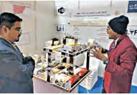
ବ୍ୟବହାର କଲେ ମଣିଷ ପ୍ରତି କୌଣସି ବିପଦ ନାହିଁ ବୋଲି ଜ୍ଞାନରଞ୍ଜନ ଦାବି କରିଛନ୍ତି।