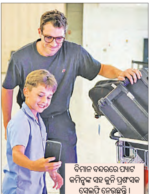
ବିମାନ ବନ୍ଦରରେ ପ୍ୟାଟ୍ କମ୍ପ୍ୟୁଟର ସହ କୁମ୍ଭାର ପ୍ରଶଂସକ ସେଲ୍ଫି ନେଉଛନ୍ତି।

ସିଦ୍ଧାନ୍ତ, ୨୨।୧୧(ଏକେଡି): ଆଇସିସି ବିନିକିଆ ବିଶ୍ୱକପ୍ ବିଜୟ ପରେ ଅଷ୍ଟେଲିଆ ଦଳର କେତେକ ଖେଳାଳି ସ୍ୱଦେଶ ପ୍ରତ୍ୟାବର୍ତ୍ତନ କରିଛନ୍ତି। ସିଦ୍ଧାନ୍ତ ବିମାନବନ୍ଦରରେ ଖେଳାଳିମାନଙ୍କୁ ସାଗର ସମ୍ବର୍ଦ୍ଧନା କରାଯାଇଛି। ଅଧିନାୟକ ପ୍ୟାଟ୍ କମ୍ପ୍ୟୁଟର ସହ ମେଡ୍ ଅନା ଖେଳାଳିମାନେ ସାଧାରଣ ଯାତ୍ରୀଙ୍କ ଭଳି ବିମାନବନ୍ଦରରୁ ବାହାରି ଯିବାରୁ ଯାତ୍ରା କରିଥିଲେ। କମ୍ପ୍ୟୁଟର ନିଜ ଟ୍ରଲି ନିକେ ନେଉଥିବାର ଦେଖାଯାଇଥିଲା। ଅନ୍ୟାନ୍ୟମାନେ ନିଜ ନିଜ କାମରେ ବ୍ୟସ୍ତ ଥିଲେ ଓ କମ୍ପ୍ୟୁଟର ସହ ଯେତେବେଳେ ଗୁରୁତ୍ୱ ଦେଉଥିଲେ। ଟପ୍ପର ପାଇଁ ଟାଙ୍କୁ ଲାଭରେ ମଧ୍ୟ ଠିଆ ହେବାକୁ ପଡ଼ିଥିଲା। ଅବଶ୍ୟ କେତେକ ସାମ୍ବାଦିକ କମ୍ପ୍ୟୁଟର ପଟେ ଉଠାଉଥିଲେ। ବିଶ୍ୱକପ୍ ବିଜୟ ଶୁଣି ଦେଇଛି ବୋଲି ସେ କହିଛନ୍ତି। ଅନ୍ୟପଟେ ଭାରତରେ କ୍ରିକେଟର ତଥା ବିଶ୍ୱକପ୍ ଚାମ୍ପିଅନ ଦଳକୁ କୋରଦାର ସାଗର କରାଯାଇଥାଏ ଓ ବିଶ୍ୱବିଜୟ କ୍ରିକେଟରକୁ ଭଜନାଟକ ଭଳି ସମ୍ମାନ ପ୍ରଦର୍ଶନ କରାଯାଇଥାଏ। ୨୦୦୬ ଟି-୨୦ ବିଶ୍ୱକପ୍ ଚାମ୍ପିଅନ ଭାରତୀୟ ଦଳକୁ ସ୍ୱଦେଶ ପ୍ରତ୍ୟାବର୍ତ୍ତନ ପରେ କୋରଦାର ସାଗର କରାଯାଇଥିଲା। ସେହିପରି ୨୦୧୧ ବିନିକିଆ ବିଶ୍ୱକପ୍ ଚାମ୍ପିଅନ ଦଳକୁ ରାଷ୍ଟ୍ରପତି ପ୍ରତିଭା ପାଟିଲ ସମ୍ବର୍ଦ୍ଧିତ କରିଥିଲେ। ୧୯୮୩ ବିଶ୍ୱକପ୍ ବିଜୟୀ ଦଳ ପାଇଁ କିମ୍ବଦନ୍ତୀ ଗାୟିକା ତଥା ସ୍ୱର ସାମ୍ରାଜ୍ଞୀ ଜିତା ମଙ୍ଗେସକର ଦିଲ୍ଲୀର ଜବାହରଲାଲ ନେହରୁ ଷ୍ଟାଡ଼ିୟମରେ ସଙ୍ଗୀତ ଭିତ୍ତିକ କାର୍ଯ୍ୟକ୍ରମ ବା ଲାଭକର କନସର୍ଟ ଆୟୋଜନ କରିଥିଲେ।