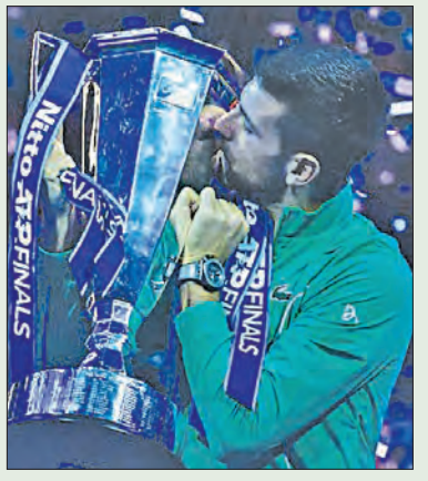
ସେହିପରି ସେ କ୍ୟାରିୟରରେ ମୋଟ ୯୮ଟି ଟାଇଟଲ୍ ଜିତି ଓପନ୍ ଏରାରେ ତୃତୀୟ ସର୍ବାଧିକ ଖେଳାଳି ବିବେଚିତ ହୋଇଛନ୍ତି।

ରୁରିମ୍, ୨୦।୧୧(ଏକ୍ସପ୍ରେସ୍): ଇଟାଲୀର ରୁରିମ୍ରେ ବର୍ଷ ଶେଷର ହାଇପ୍ରେଫାଇଲ ପୁରୁଷ ଟେନିସ୍ ଚୁଣ୍ଟାମେଣ୍ଟ ଏସିଏସି ଫାଇନାଲ୍ ଅନୁଷ୍ଠିତ ହୋଇଛି। ସର୍ବଥର ଅଭିଜିତ ଖେଳାଳି ନୋଭାକ ଜୋକୋଭିଚ୍ ଚୁଣ୍ଟାମେଣ୍ଟରେ ଏହି ୫୪ତମ ସଫ୍ଟୱେରରେ ଚାମ୍ପିଅନ ହେବାର ଚୈତ୍ର ଅର୍ଦ୍ଧ କରିଛନ୍ତି।