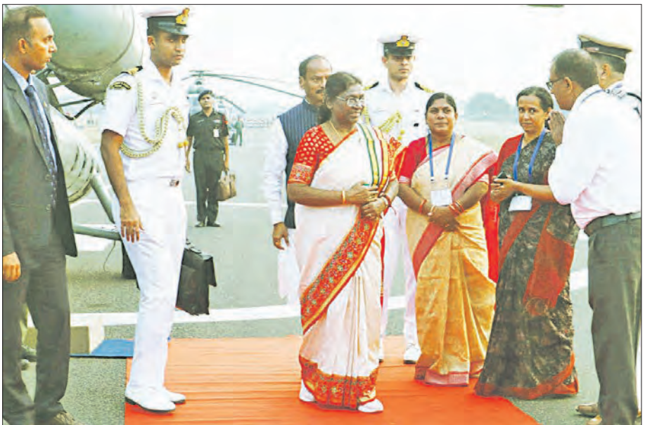
ଯୋଗେ ଅପରାହ୍ଣ ସାଢ଼େ ୪ଟାରେ ଅବତରଣ କରିଥିଲେ। ରାଜରଜାପୁରରେ ପହଞ୍ଚିବେ।