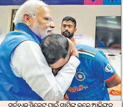
ସର୍ବାଧିକ ଓକେଟ୍ ପାଇଁ ସାମିଙ୍କୁ କଲେ ଆଲିଙ୍ଗନ

ଅହମ୍ମଦାବାଦ୍, ୨୦।୧୧(ଏକ୍ସପ୍ରେସ୍): ବିଶ୍ୱକପ୍ ଫାଇନାଲ୍ ମ୍ୟାଚ୍ରେ ଅଷ୍ଟ୍ରେଲିଆଠାରୁ ଭାରତ ହାରିବା ପରେ ପ୍ରଧାନମନ୍ତ୍ରୀ ନରେନ୍ଦ୍ର ମୋଦି ଡ୍ରେସିଂ ରୁମ୍ ଯାଇ ନିଜ ଖେଳାଳିମାନଙ୍କୁ ସାନ୍ତ୍ୱନା ଦେଇଥିଲେ। ବିଶ୍ୱକପ୍ରେ ସର୍ବାଧିକ ଓକେଟ୍ ହାସଲ କରି ଭାରତର ହିରୋ ବିବେଚିତ ହୋଇଥିବା ଦୁଇ ବୋଲର ମହମ୍ମଦ ସାମିଙ୍କୁ ସେ ଆଲିଙ୍ଗନ କରିଥିଲେ।