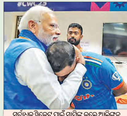
ସର୍ବାଧିକ ଓପେନିଂ ବୋଲ୍ ସାମିଲ କରିଥିବା ଆଇସିସି