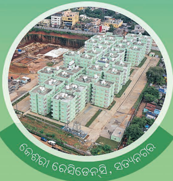
କେଶରୀ ରେସିଡେନ୍ସିଆଲ୍, ସତ୍ୟନଗର