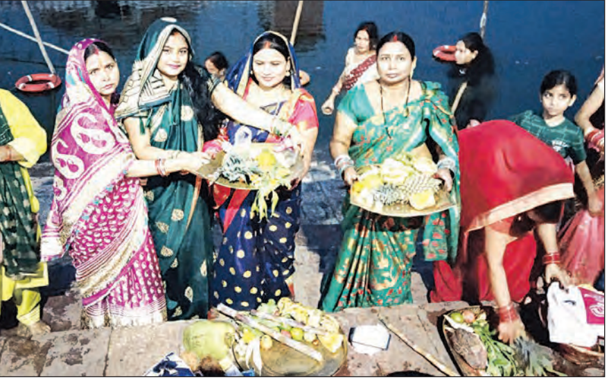
ପୁରୀର ଏତିହ୍ୟ ନରେନ୍ଦ୍ର ପୁଷ୍ପରିଣାରେ ମହିଳାଙ୍କ ଜଙ୍ଗ୍ ପୂଜା

କିଛି ଗ୍ରାମବାସୀଙ୍କ ସହାୟତାରେ ଅଜା ନାରସ୍ ସେଣ୍ଟରକୁ ନୂକ ଅନ୍ତର୍ଗତ କାନ୍ତିପୁର ଗାଁରେ ପୋଖରୀରେ ବୁଡ଼ି ଦୁଇ ଭଉଣୀଙ୍କ ମୃତ୍ୟୁ ଘଟିଛି।