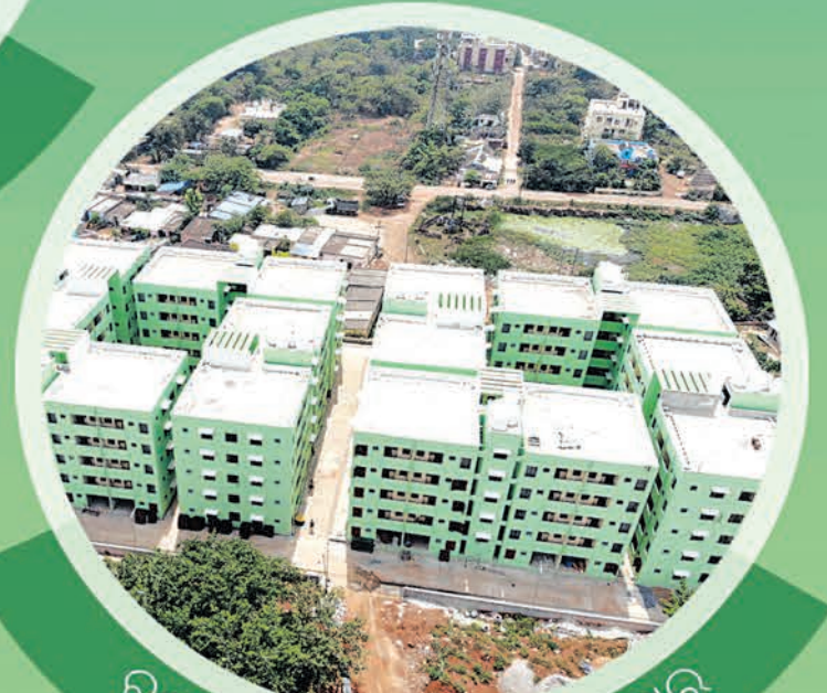
ବରୁଣେଇ ଏନକ୍ଲେଭ୍, ସୁରୁଧ୍ରପୁର